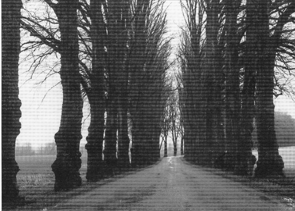
Allén vid Kyleberg en vårdag före lövsprickningen

Det är inte bara för de nyplanterade alléernas skull man hade velat vara med. Mera då för tidens tro på naturen som fundament. Detta att fågelrikedomen hade en kraft som knappast räknade förluster. Må vara att registreringen var usel, ingen mätte. I den nyskapade fågelsjön slog redan invandringsvågen; brunänder, doppingar, rörsångare, snart skrattmåsar, fler och fler svanar.